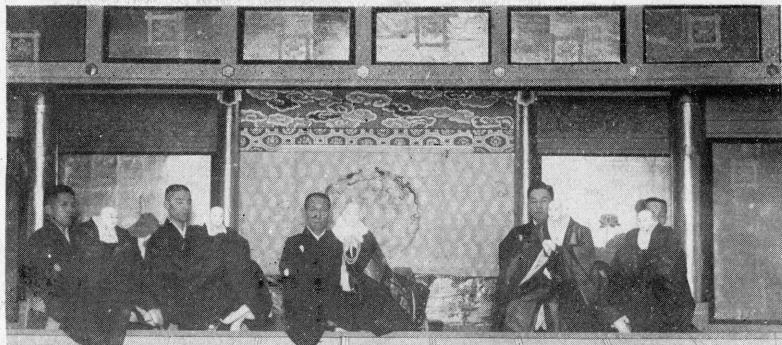
(三榮) 蓮日 (郎十紋) 朗日・段の寺門本 [海法御人聖蓮日]