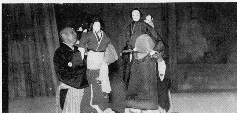
(郎五文) んゆしお (郎太扇) 衛兵傳・段のし廻猿川堀 [上 同]