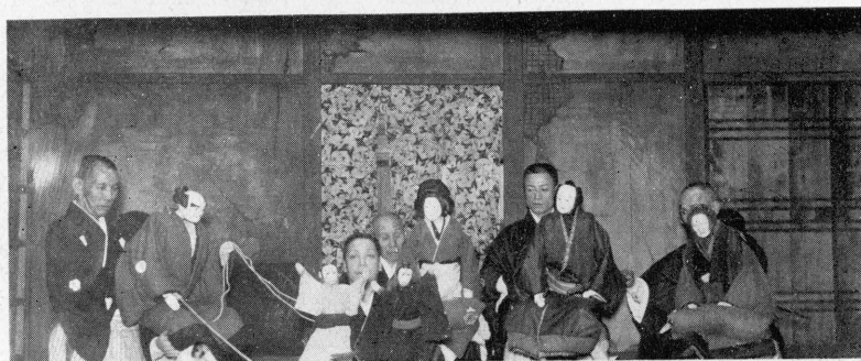
(郎太扇) 衛兵傳 (吉兵小) 母郎次與・段のし廻猿川堀 [引達の原河頃近] (三榮) 郎次與 (郎五文) んゆしお