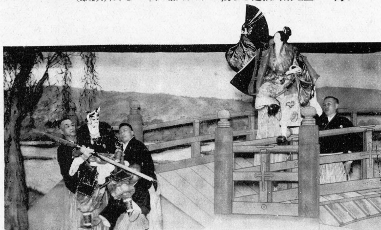
(龜政) 慶 巖 (郎十紋) 丸若牛・段の橋條五 [巻略三眼法一鬼]