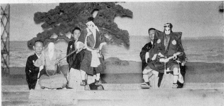
(三榮) 蓮日 (助之傳) 平丹塚平 (幸玉) 官判條東・段の口の龍 [上 同]