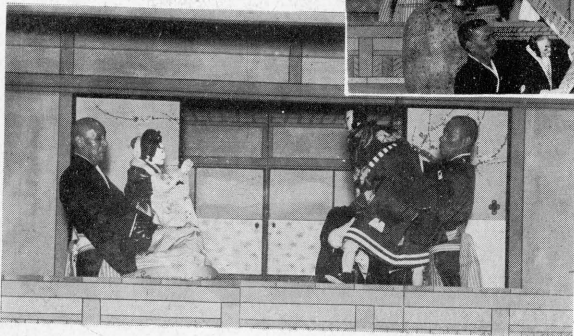
“ 茶 屋 場 ”