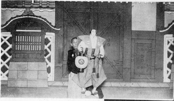
“ 明 渡 し ”