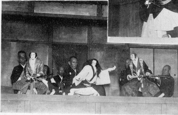
“ 身 賣 ”