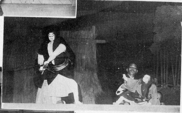
“ ニ ツ 玉 ”