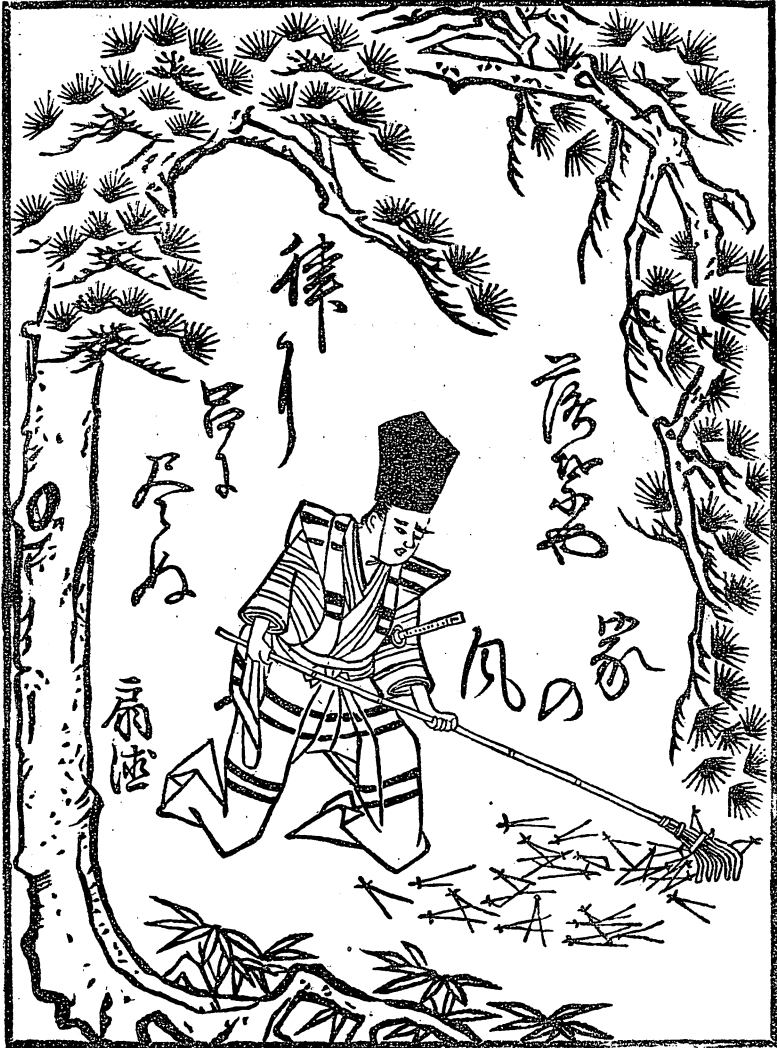
(しへか見の巻首葉落の松)