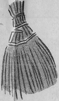
手箒 藁製七寸五分