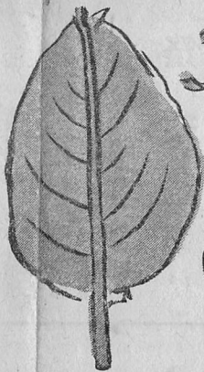
油紙製 真中から二つに割れる仕掛 一尺一寸五分