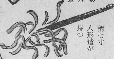
柄七寸 人形遣が持つ